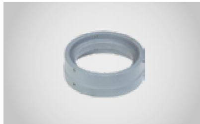
PN: 1695 606 200 Dystans do bliźniaków Cena: 609zł netto