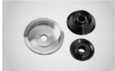
PN: 1695 654 849 Zestaw stożków 88-174mm Cena: 1557zł netto