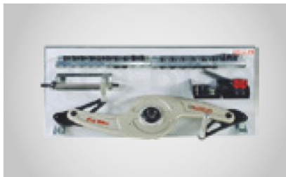
PN: 1695 654 039 Uchwyt motocyklowy 19mm Cena 4307zł netto