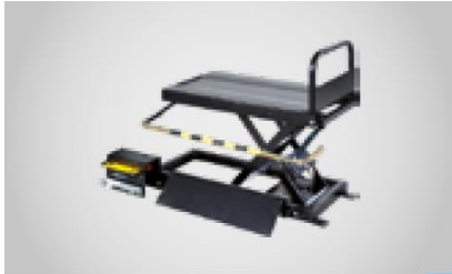
PN: 1695 900 004 Winda koła Cena 5873zł netto